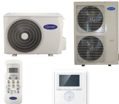
Standard trådløs fjernbetjening